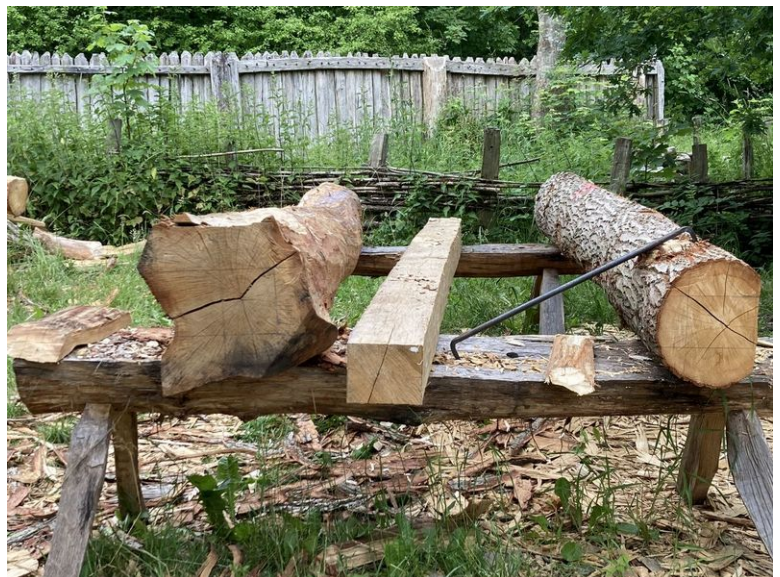
I midten en færdig bjælke, th. her er den ene side tilhugget, tv. her en hele stammen med afmærkning af hvor bjælken skal hugges ud

Vi håber stadig, at huset vil stå klart til brug i foråret 2023.